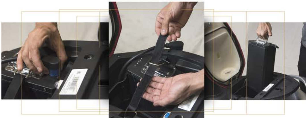
Batería de litio extraíble.